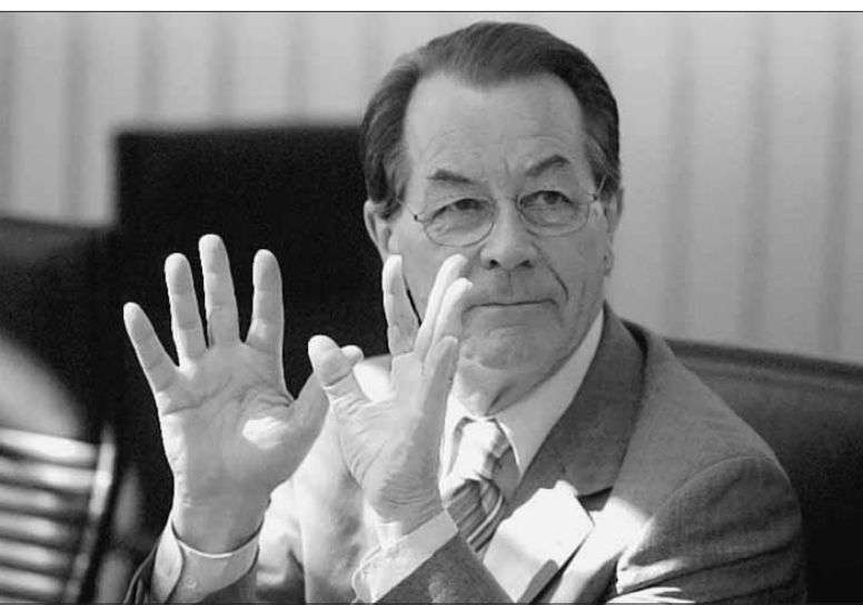
SPD-Chef Müntefering wartet auf den Beginn der Sitzung des SPD-Präsidiums im Berliner Willy-Brandt-Haus. Konkretes zum Wahlprogramm wurde offenbar während des Treffens nicht beschlossen.

Der SPD-Chef hat sich im Präsidium der Partei zwar erstmals ein wenig in die Karten schauen lassen, was das Wahlmanifest betrifft, an dem er und Gerhard Schröder basteln. Doch wie der Balance-Akt zwischen Agenda 2010 und dem Drängen der Partei nach sozialer Profilierung konkret aussehen wird, verbirgt „Münte“ noch. Am Sonntag soll das Präsidium dann erstmals schriftlich das Papier er-