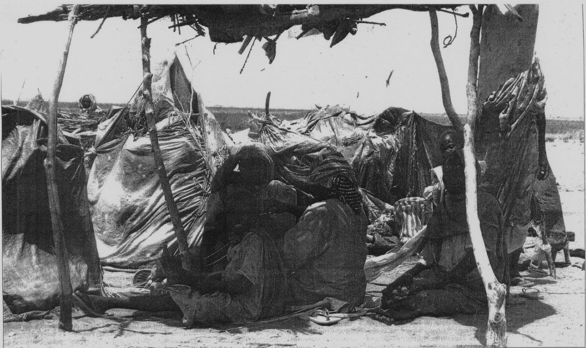
Selbstgezimmerter Unterschlupf im Es Sallam-Camp in Darfur: Helfer der Vereinten Nationen, die neue Lager eröffnen wollen, scheitern an bürokratischen Hürden der sudanesischen Regierung