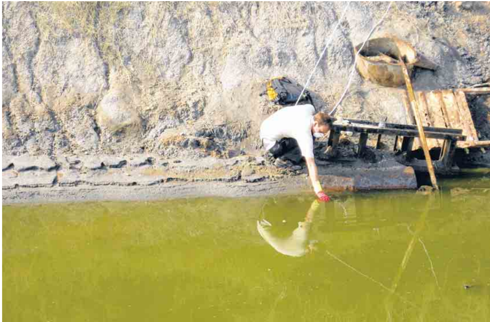
Trinken verboten: Der Menschenrechtler Klaus Stieglitz nimmt neben dem

Über Rier hängt eine Glocke der Schwermut. Die Bretterhütten des Dorfes sind mit leeren Säcken abgedichtet. Eines der wenigen gemauerten Gebäude ist eine einräumige Polizeistation: Als Gefängnis dient ein Container. Aus