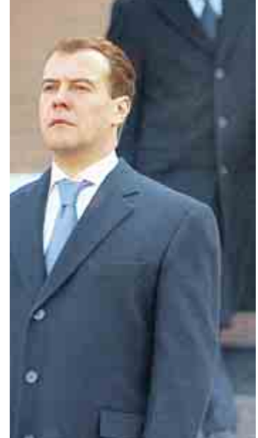
Präsident Medwedew (l.) und sein Förderer Premier Putin.

Wie genau der Abhördienst Google jetzt helfen soll, Sicherheitslücken zu schließen, ist nicht bekannt. Laut Washington Post haben seit Jahren auch andere Firmen die NSA um Hilfe gebeten. Kein Geheimnis ist hingegen, dass auch die Obama-Regierung über zunehmende Versuche elektronischer Wirtschaftsspionage bei US-Schlüsselunternehmen alarmiert ist. Geheimdienstdirektor Dennis Blair nannte die Cyberattacken auf Google „einen Weckruf“. Zahl und Niveau solcher Angriffe wüchsen beispiellos. Um den US-Datenverkehr sicherer zu machen, hatte Präsident Barack Obama im Dezember einen „Cyber-Zaren“ berufen. Kritiker sehen in der Allianz indes den Versuch, den Teufel mit dem Beelzebub auszutreiben.