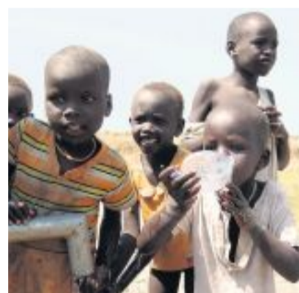
Der Gefahr ausgesetzt: Südsudanesische Kinder an einem Brunnen.