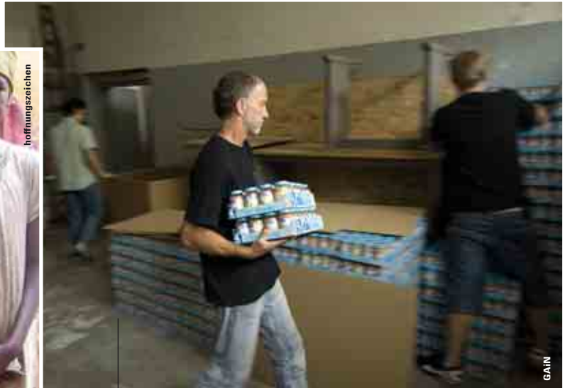
Per Lkw schicken wir gemeinsam mit unserem Partner GAIN Hilfsgüter nach Lettland.

zeitlich befristete Geldanlage. Das Vermögen wird nach der Laufzeit automatisch von der Bank direkt wieder auf das Konto des Spenders zurückgezahlt, soweit der Spender die Laufzeit nicht verlängert oder den Betrag bewusst in das Grundstockvermögen der Stiftung einfließen lässt. Von den Zinserträgen werden über den Vertragszeitraum sinnvolle und nachhaltige Projekte finanziert.