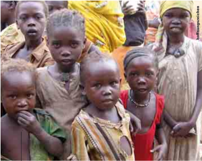
In der Schule in Raja im Sudan unterstützen wir die Schüler mit Nahrungsmitteln und Schulmaterial.