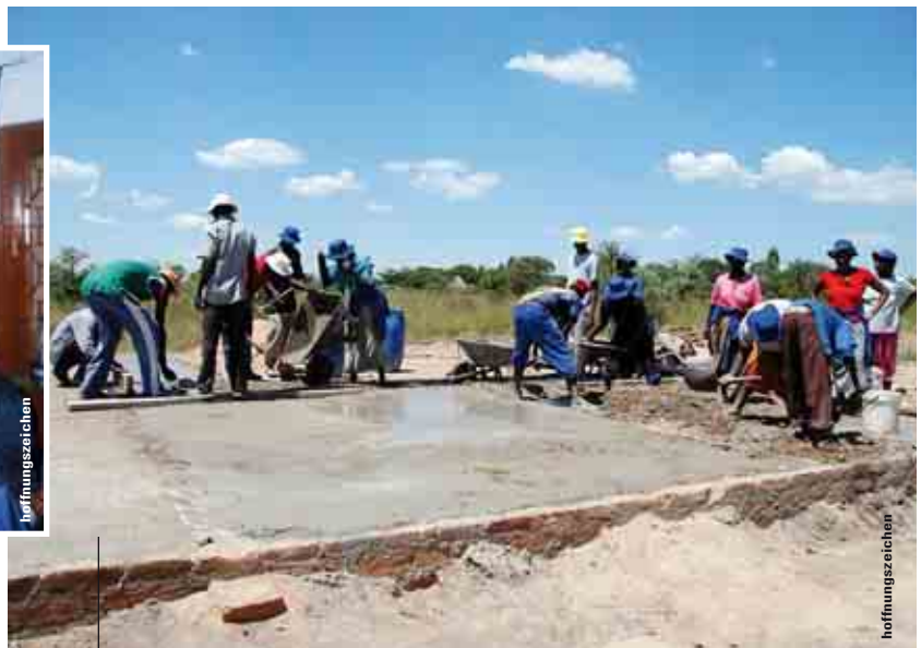
Gemeinsam anpacken – in Simbabwe bauen Einheimische ein Hoffnungszeichen-Waisenhaus für 100 Kinder.