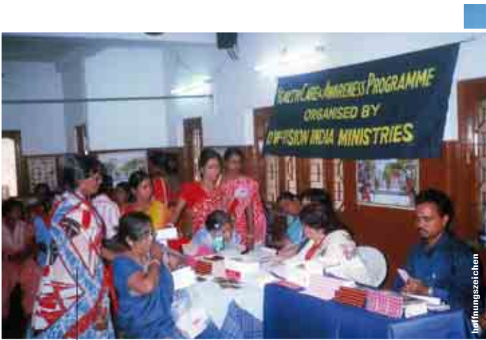
Unser neues Projekt: medizinische Grundversorgung in den Armenvierteln von Kalkutta (Indien).