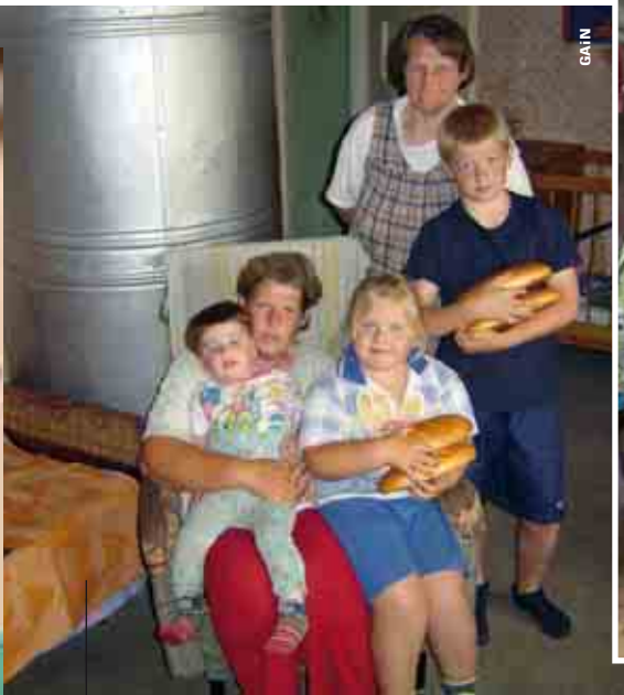
In Lettland gibt es eine große Kluft zwischen arm und reich.