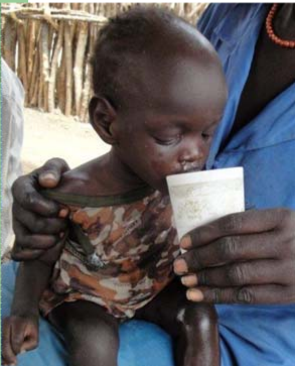
Unsere medizinische Versorgung hilft nicht nur den Müttern, sondern auch den Kindern.