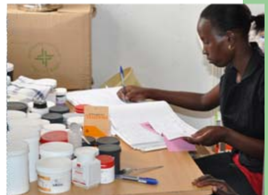
Die langen Transportwege zur Klinik sind eine logistische Herausforderung. Für den Klinikbetrieb sind eine exakte Lagerbuchführung und Medikamentenverwaltung wichtig.