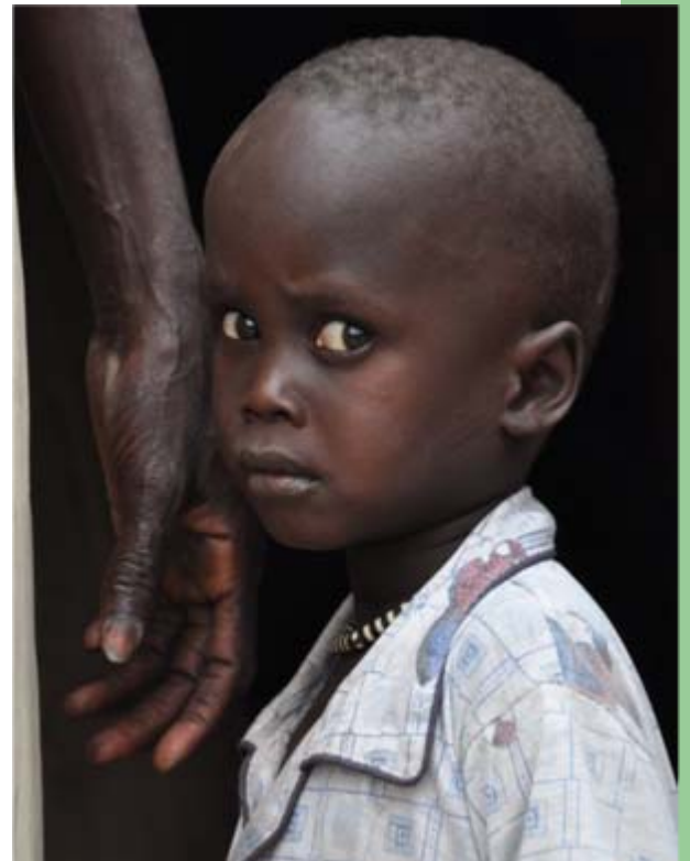
In Duong fehlt es den Menschen an Nahrung, Bildung und adäquater Gesundheitsfürsorge.