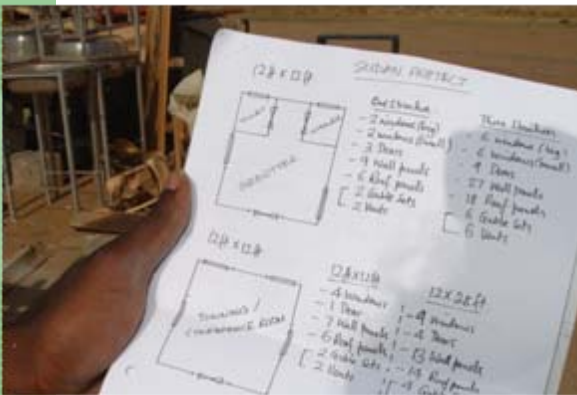
Aus den Plänen wird Wirklichkeit ...