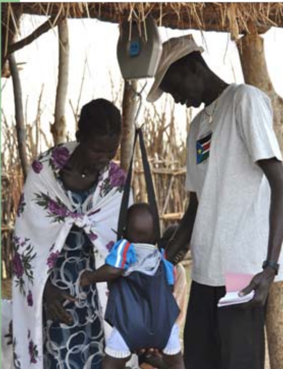
In unserer Krankenstation behandeln wir viele Schwangere, Mütter und ihre Kinder.