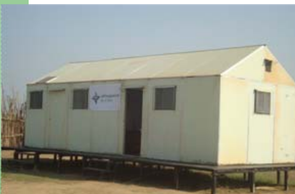
... Ende 2009 sind die ersten Gebäude fertig gestellt und eingerichtet, das Klinik-Personal nimmt den Betrieb auf.