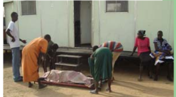
Ein Patient wird in die Klinik gebracht.