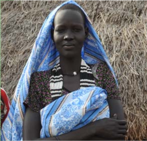
Von 36 Frauen im Südsudan stirbt aktuell eine bei der Geburt eines Kindes. (Quelle: WHO)