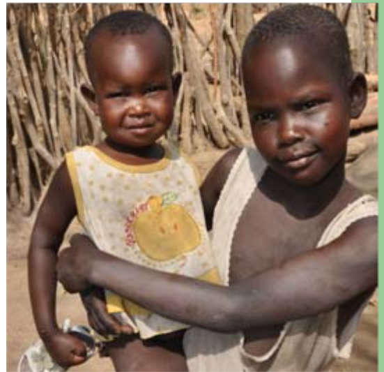
Mehr als die Hälfte der Patienten in Duong sind Kinder unter 15 Jahren.