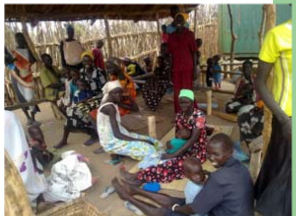
Mütter und ihre Kinder warten auf dem Klinikgelände, bis sie an der Reihe sind.